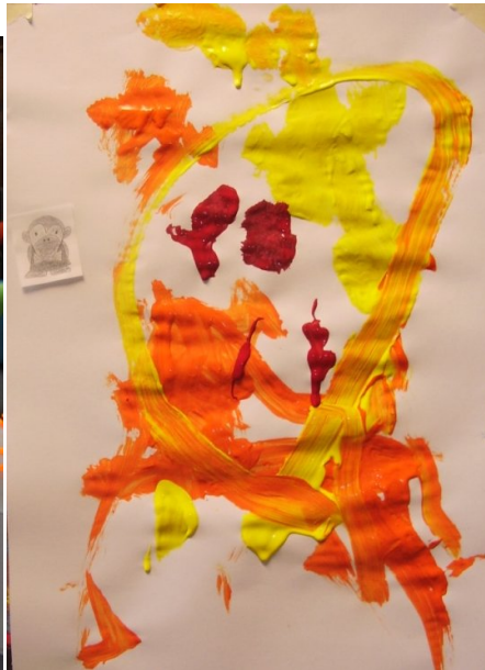
Siebe: "Da is Siebe"

Er werd ook al heus wat gefeest in ons klasje.... We zijn al volleerd pannenkoeken-bakkers!