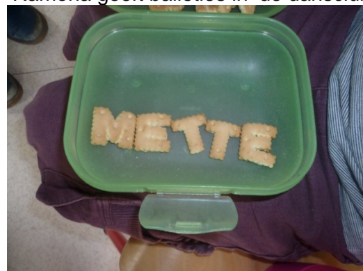
Mette legt haar naam met nic-nacjes

Om onze nieuwe vriendjes nog wat beter te leren kennen kan je altijd een kijkje gaan nemen op onze blog!