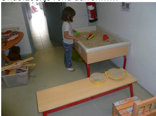
Priya maakt gebakjes