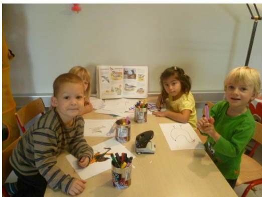
Onderzoekje rond duiven.....

Hier enkele sfeerbeelden uit ons klasje: